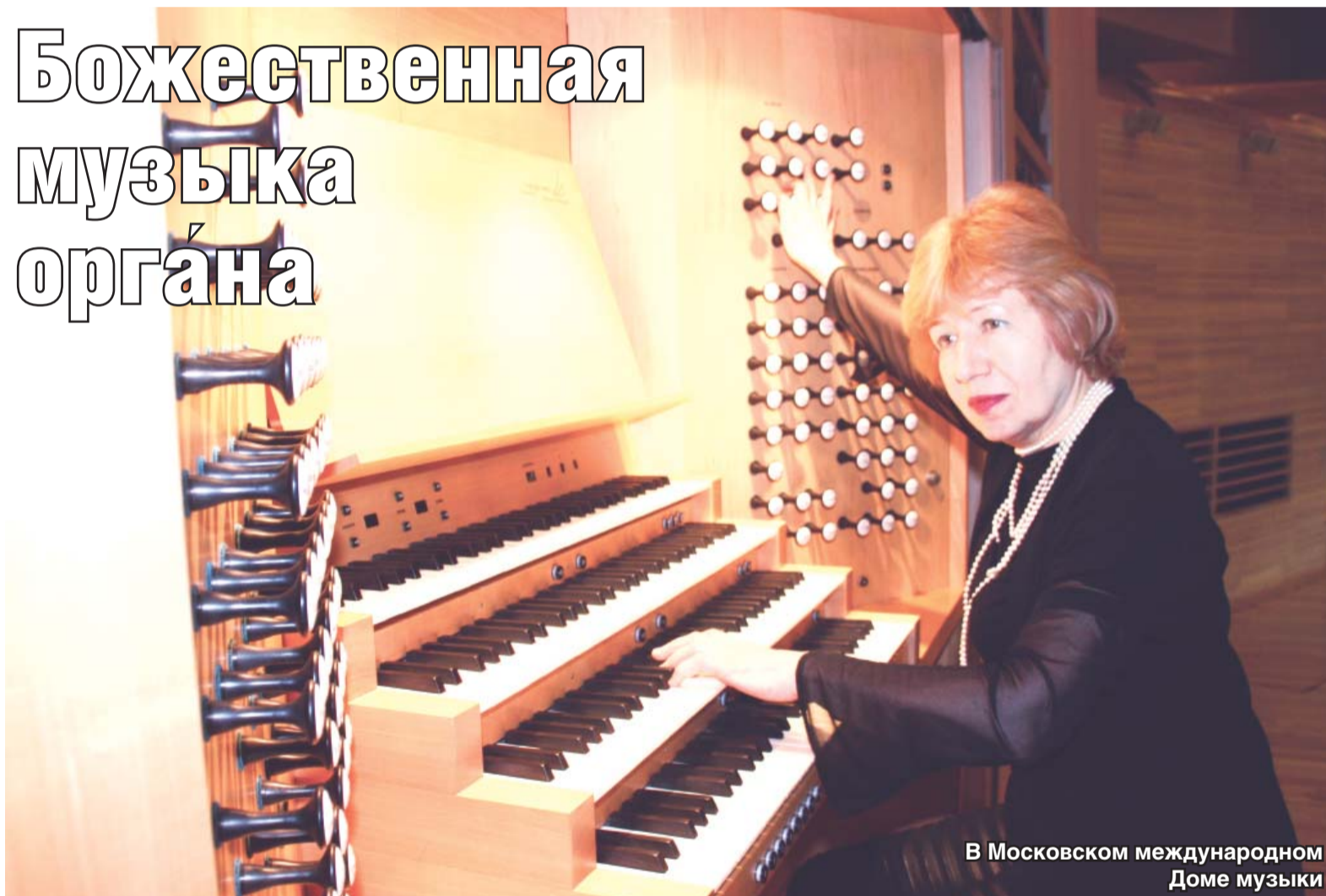
В Московском международном Доме музыки