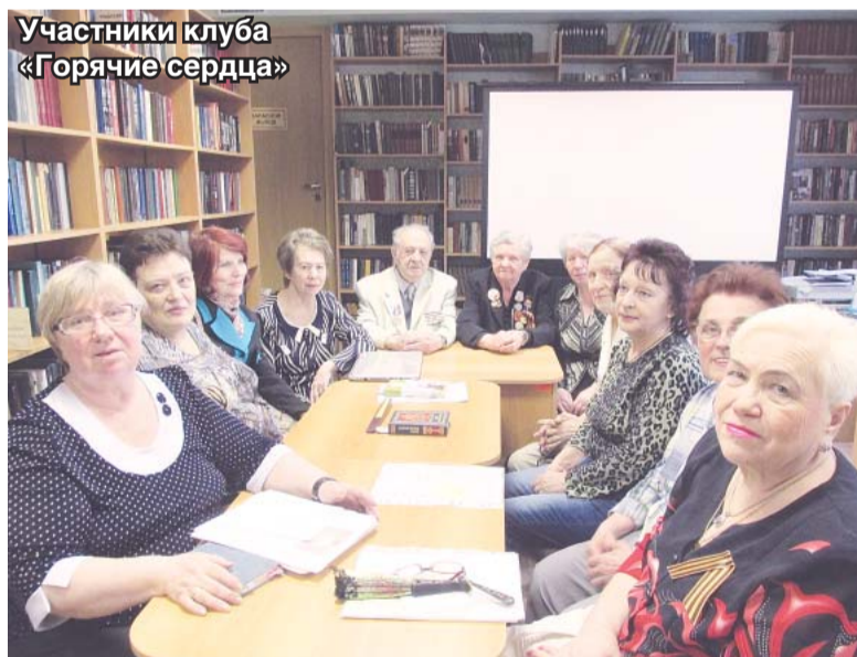
Участники клуба «Горячие сердца»

О фронтовой юности, о том, что у войны совсем не женское лицо писала в своих стихотворениях Юлия Друнина. Пережитое на войне стало отправной точкой и сквозной темой ее творчества. Поэтесса закончила войну в звании старшины медицинской службы. Но в своих стихах она писала не только об обстрелах, о смерти, о боли и отчаянии, но и о любви. Мало того, любовная тема играла в ее творчестве огромную роль. В послевоенной жизни она была последним романтиком уходящей эпохи.