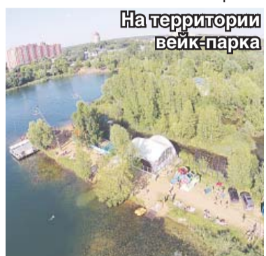
На территории вейк-парка

– Если ещё несколько лет назад вейк-парк мы предполагали использовать только как трени-