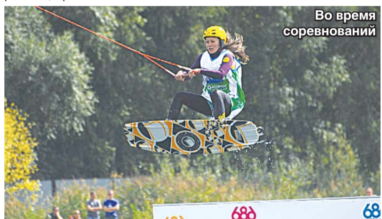
Во время соревнований