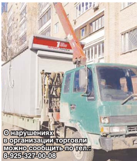
© нарушениях в организации торговли можно сообщить по тел.: 8-925-327-00-08