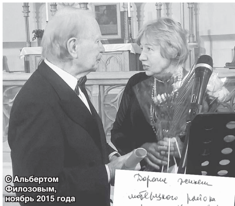
© Альбертом Филозовым, ноябрь 2015 года

– Вы выступали во многих странах. Где преимущественно ценится органная музыка?